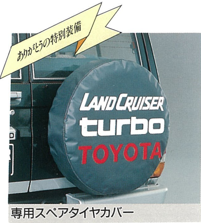
ありがとうの特別装備 専用スペアタイヤカバー