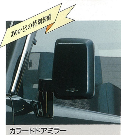
ありがとうの特別装備 カラードアミラー