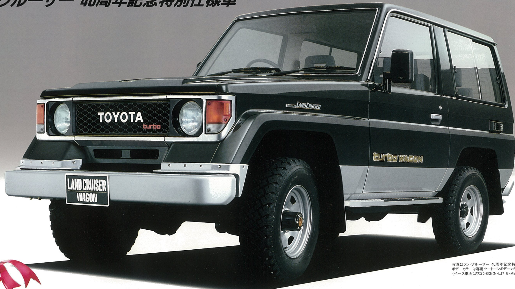
写真はランドクルーザー 40周年記念特別仕様車 ポデーカラーは専用ソートーンポデーカラー《20E》 (ベース車両はワゴンSX5《N-LJ71G-MEX》)