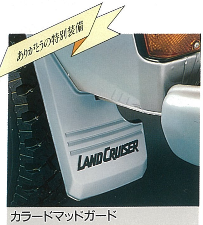
ありがとうの特別装備 カラードマッドガード