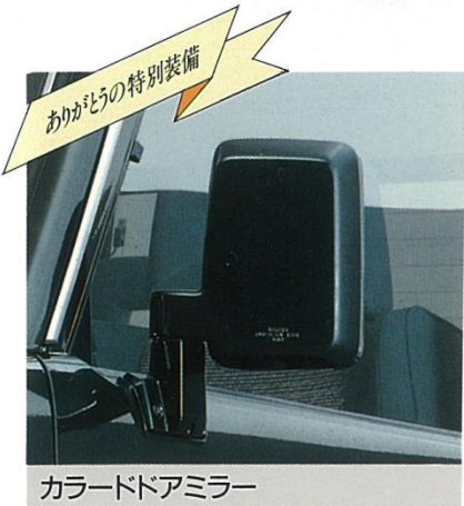
カラードアミラー