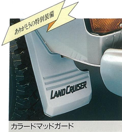
カラードマッドガード