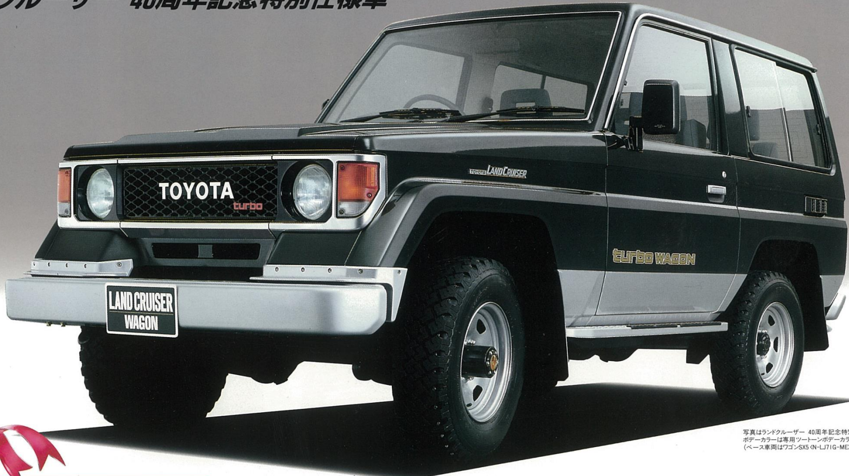
写真はランドクルーザー 40周年記念特別仕様車 ボデーカラーは専用「ツートンボデーカラー〈20E〉」 (ベース車両はワゴンSXS〈N-LJ71G-MEX〉)