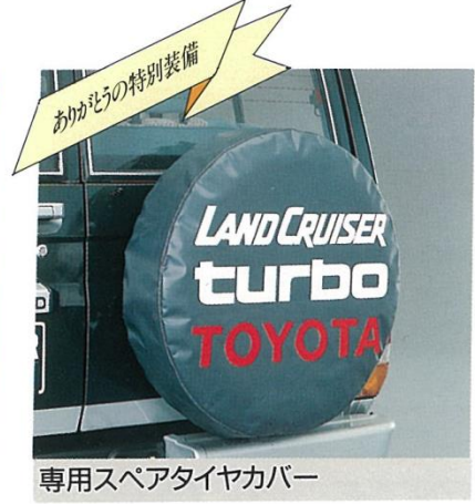
専用スペアタイヤカバー