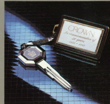
30周年記念キープレートThe 30th Limited をご成約ください。こちらにもれなく差しあげます。