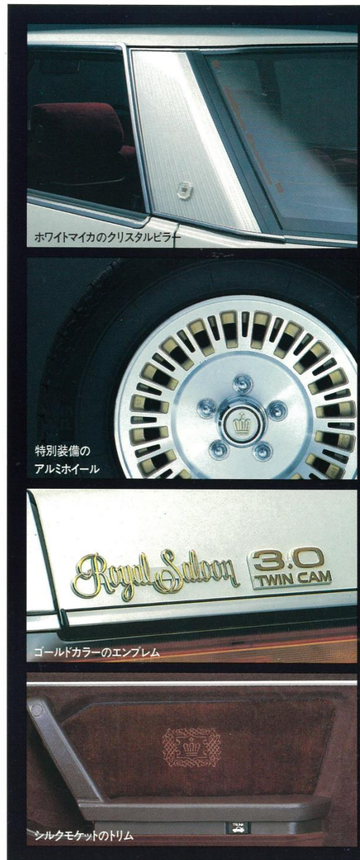
ホワイトマイカのクリスタルピラー