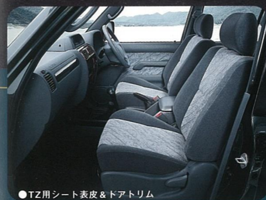
● TZ用シート表皮&ドアトリム

PHOTO:特別仕様車TX Limited(ベース車両はTX 2700ガソリン) ボデーカラーは、ダークグリーンマイカメタリック<K12> フロントバンパーガード、チルト&スライド電動式ムーンルーフ、フィロドモニターは、メーカーオプション