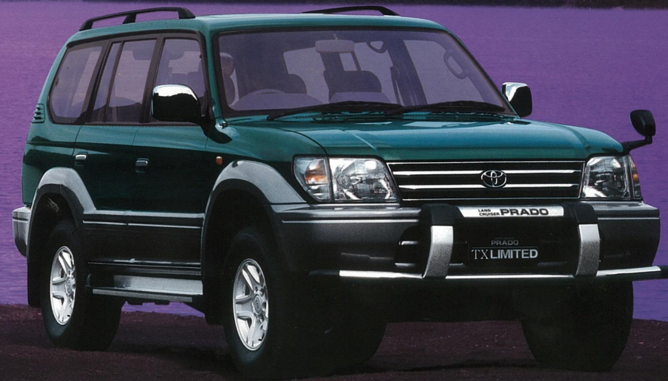
PHOTO:特別仕様車TX Limited(ベース車両はTX 2700ガソリン) ボデーカラーは、ダークグリーンマイカメタリック<K12> フロントバンパーガード、チルト&スライド電動式ムーンルーフ、フィロドモニターは、メーカーオプション

落ち着いたカラーリングと、 ひとクラス上の装備品。 特別なTXは、 大人の遊び心を知っている。