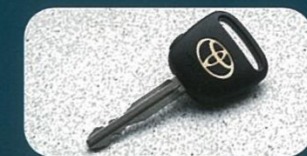
● ワイヤレスドアロックリモートコントロール