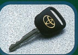
● ワイヤレスドアロック リモートコントロール