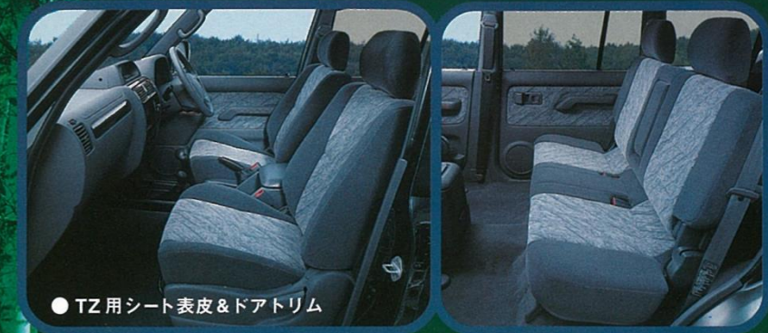
● TZ用シート表皮&ドアトリム