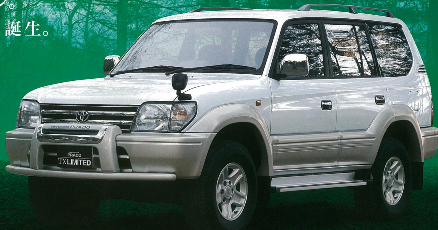
PHOTO:特別仕様車 "TX Limited" (ベース車両はTX 3000 インタークーラー付ディーゼルトーボ)。 ボディカラーの、ホワイト<K72>は Limited 専用色。 フロントバンパープロテクターはメーカーオプション。チルト&スライド電動式ムーンルーフとフィールドモニターはセットで、メーカーオプション。